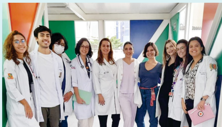
O caso foi apresentado no dia 12 de julho