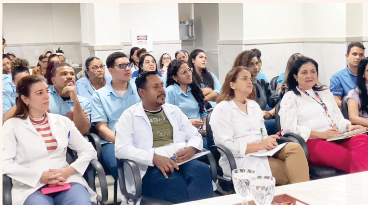
O Auditório Ariano Suassuna ficou lotado