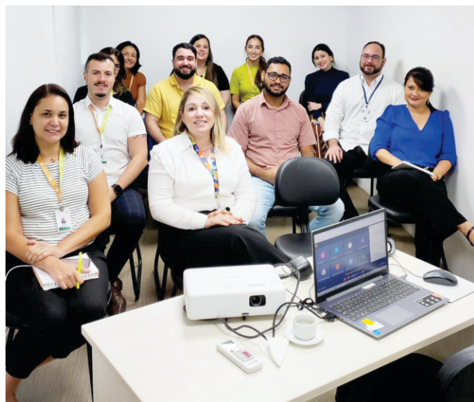
O treinamento foi realizado na sede do Núcleo Gestor

“A formação pedagógica e o treinamento são fundamentais para garantir que os profissionais da educação estejam preparados para oferecer um ensino de qualidade. No contexto do Hospital Maria Lucinda e suas filiais, a plataforma Educa Mais pode desempenhar um papel decisivo ao oferecer cursos e treinamentos EAD, possibilitando a formação contínua dos funcionários e do público externo. Sendo assim, essa modalidade EAD é especialmente vantajosa porque permite o acesso ao conteúdo de qualquer lugar e a qualquer momento, facilitando a conciliação com as demandas do trabalho hospitalar. Além disso, promove a inclusão e a democratização do conhecimento, alcançando um público mais amplo e diversificado. Investir na formação contínua por